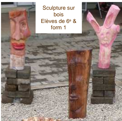
Sculpture sur bois Elèves de 6 e & form 1

1 & 2 : Technique de la photographie . A partir d'une partie de photo tirée d'un magazine que l'élève colle sur sa feuille, (1) il reproduit le reste de la photo en respectant les proportions ou (2) il reproduit en agrandissant la photo à partir de grilles qu'il fera lui-même.