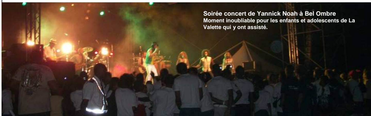
Soirée concert de Yannick Noah à Bel Ombre Moment inoubliable pour les enfants et adolescents de La Valette qui y ont assisté.