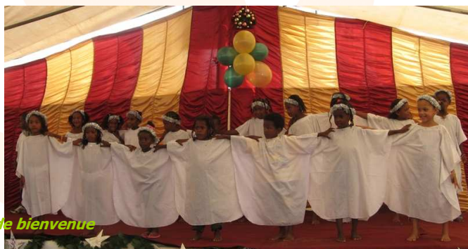
Chant de bienvenue

Les enfants qui participent au projet éducatif de QDL ont, avec leurs animateurs et pendant plusieurs semaines, répété des chants de Noël dont certains dans des versions très rythmées en langue créole. Ils ont aussi présenté un tableau vivant sur la nativité et des danses. Outre les petits, des adolescents et des adultes du village ont montré leurs talents en chantant, en jouant de divers instruments, à l'instar de ceux de l'école de ravane, et en dansant. Après le spectacle, les membres de QDL avec le concours de l'Association des Anciennes du Couvent de Lorette de Rose-Hill ont procédé à la distribution de cadeaux.