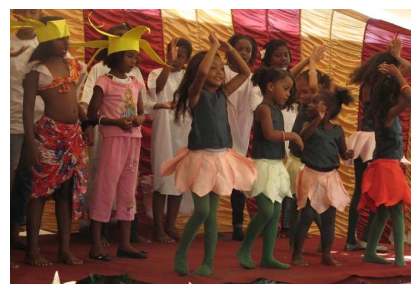
Chant et danse de la création avec le soleil, les fleurs, les poissons et les enfants.