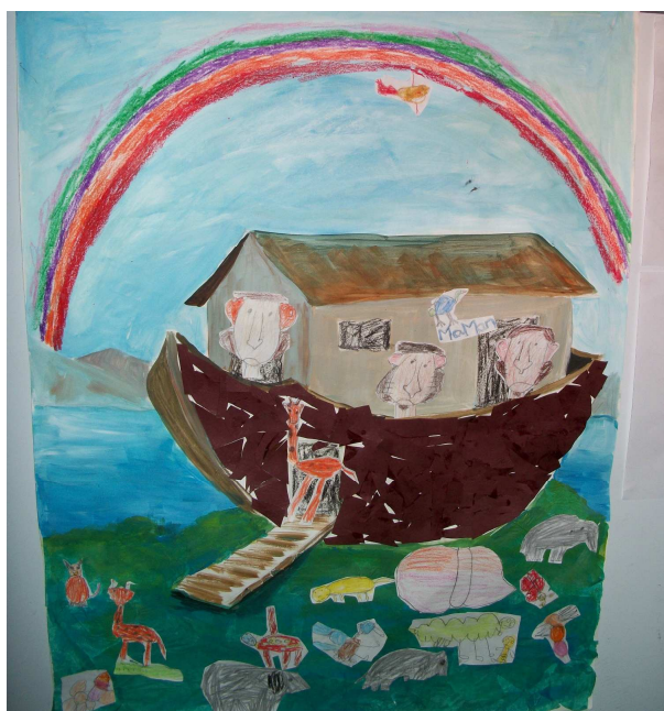
Mix media réalisé par l'atelier des enfants de 5 à 6 ans dans le cadre du projet éducatif de QDL à La Valette Bambous et dont l'image a servi de couverture à notre carte de vœux.