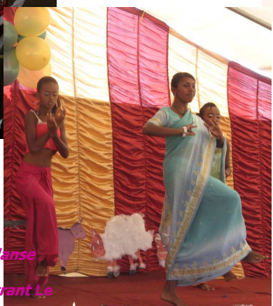
Une gracieuse danse indienne, très appréciée, illustrant le cosmopolitisme mauricien