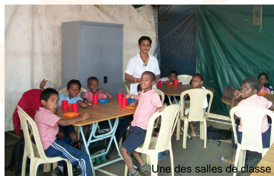
Une des salles de classe