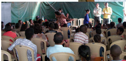
Après-midi de contes avec la troupe des Favory

d e s a c t i v i t é s e t s o r t i e s