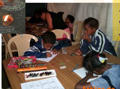
Atelier de dessin