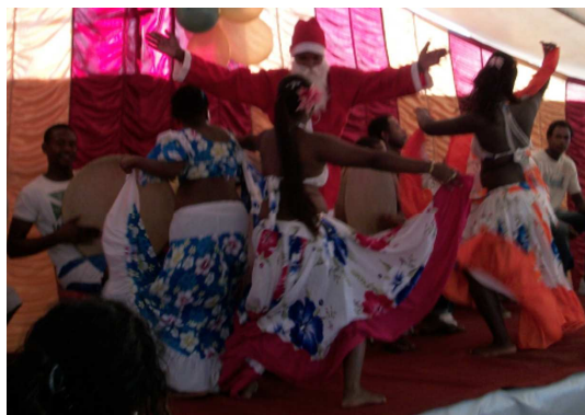
Une fête sans séga..., même le Père Noël n'a pu y résister