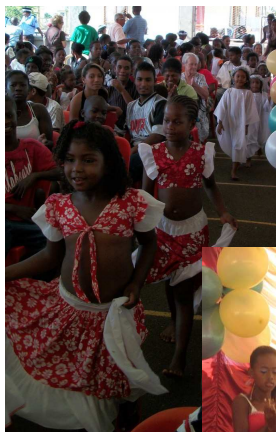
Défilé au son des raves

Les enfants qui participent au projet éducatif de QDL ont, avec leurs animateurs et pendant plusieurs semaines, répété des chants de Noël dont certains dans des versions très rythmées en langue créole. Ils ont aussi présenté un tableau vivant sur la nativité et des danses. Outre les petits, des adolescents et des adultes du village ont montré leurs talents en chantant, en jouant de divers instruments, à l'instar de ceux de l'école de ravane, et en dansant. Après le spectacle, les membres de QDL avec le concours de l'Association des Anciennes du Couvent de Lorette de Rose-Hill ont procédé à la distribution de cadeaux.