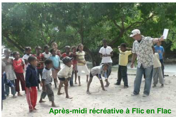
Après-midi récréative à Flic en Flac