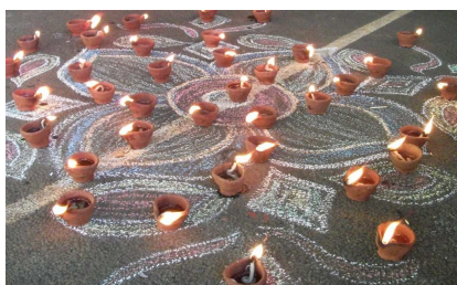
Création pour Diwali