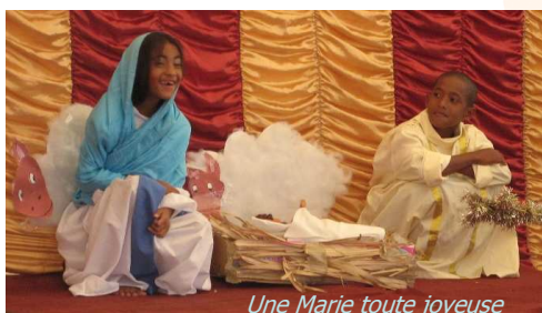
Une Marie toute joyeuse

Quartier de Lumière (QDL) a organisé une fête de Noël pour les enfants de La Valette Bambous le dimanche 19 décembre. Cette année elle englobait les 200 familles du village intégré. Vu le nombre important de personnes, les invitations ont été limitées aux enfants de 0 à 15 ans accompagnés d'un parent. Une collation avec gâteaux et jus leur a été offerte dès 15 heures et à 16 heures un spectacle varié de chants, danses et sketches a enthousiasmé l'assistance pendant plus d'une heure et demie.